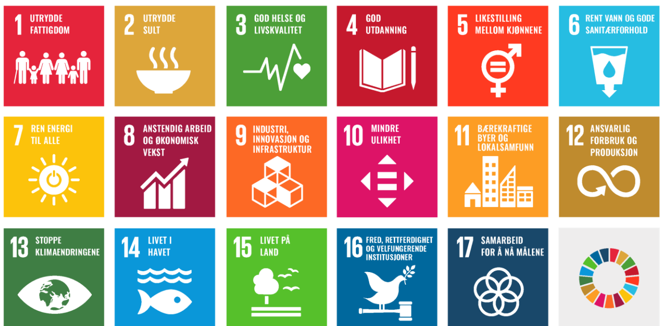
Figur 3 Viser FNs 17 bærekraftsmål (FN sambandet).

FNs bærekraftsmål er verdens felles arbeidsplan for i fellesskap å utrydde fattigdom, bekjempe ulikhet og stoppe klimaendringene innen 2030. Målene skal fungere som en felles global retning for offentlig forvaltning, næringsliv og sivilsamfunn.