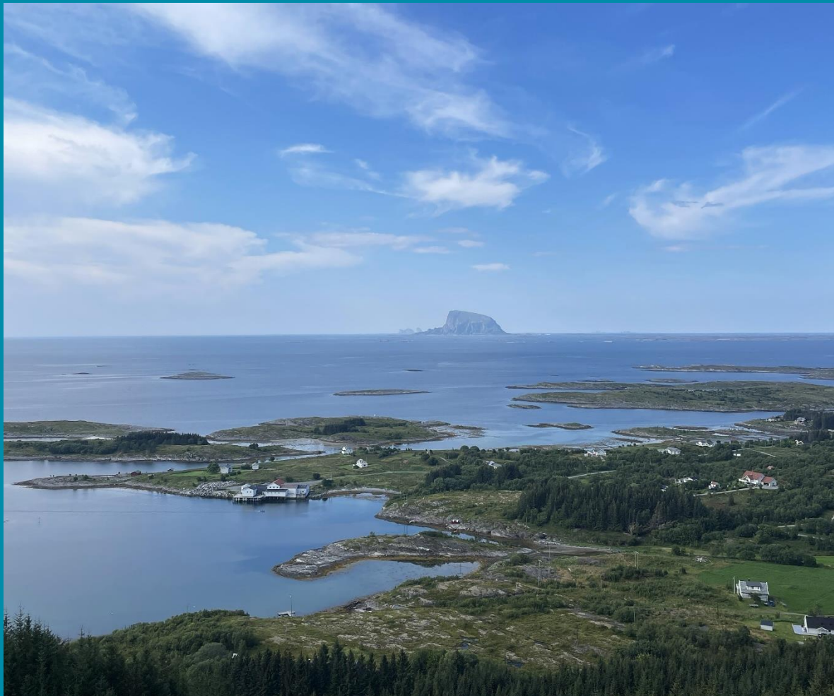
Bilde 1: Vega kommune i Nordland.